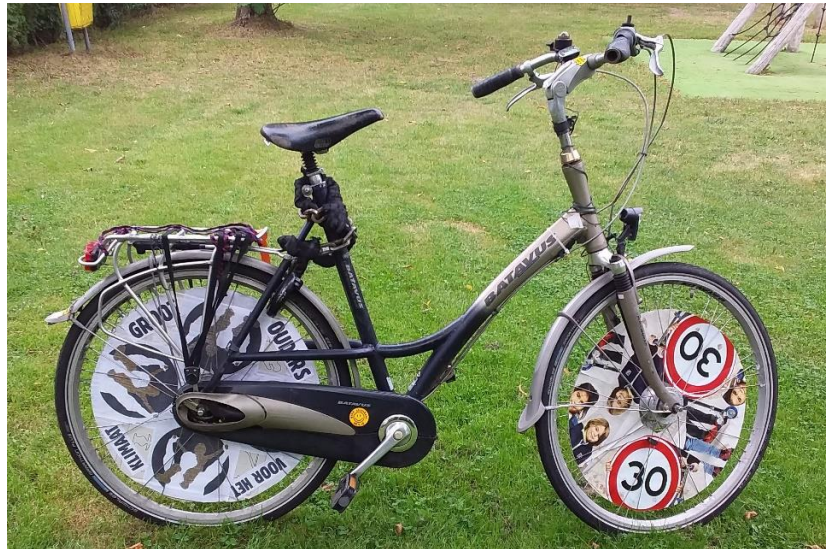
De foto toont een mogelijk eindresultaat