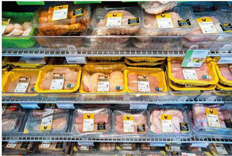
Kippenvlees in de koeling van Albert Heijn.

René van der Luer 9 december 2021, 07:00